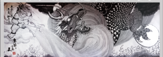
本堂龍華殿に配置される水墨作家堂野夢酔氏の作品「双龍風雷圖」。 雲龍院で世の平穩を見守り続ける双龍をごゆっくりご覧下さい。